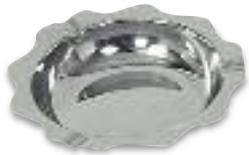
Stainless Ashtray Cenicero inoxidable